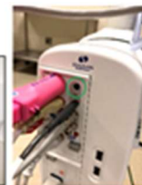
Spacelabs monitorport (Använd h1o1 för P1; h1o2 för P2)