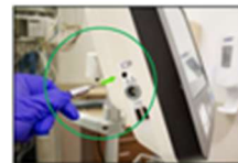
Kabel till ARGOS-ingång